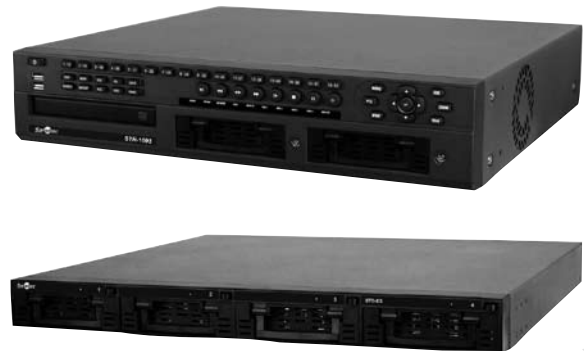
* Дисковый массив STG-ES заказывается дополнительно

Уникальной особенностью STR-1693 является наличие 4 независимых мультиэкран­ных мониторяных выходов, на каждом из которых можно просматривать видео от различных групп телекамер (просмотр текущего видео и воспроизведение архива). Таким образом, с помощью одного видеореги­стратора можно организовать четыре независимых поста